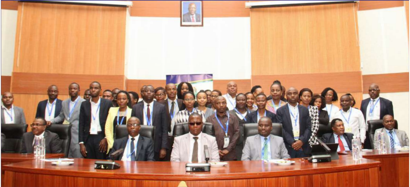
Picha ya pamoja katika ufunguzi wa mafunzo kwa mawakili wa serikali.

Mawakili wa Serikali wametakiwa kufuata sheria, kanuni na miongozo wakati wa kusimamia na kuratibu mashauri yote ya Madai, Usuluhishi, Katiba pamoja na Haki za Binadamu yatakayofunguliwa dhidi ya Serikali katika Mahakama mbalimbali ndani na nje ya nchi.