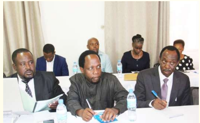
Baadhi ya Wajumbe wa Baraza waliohudhuria kikao cha Baraza la Wafanyakazi wakifuatilia mijadala mbalimbali iliyojadiliwa katika kikao hicho kama wanavyoonekana kwenye picha

Aidha amesema ofisi hiyo inakabiliwa na changamoto mbalimbali ikiwamo ya kukosa muundo wa uendeshaji wa ofisi hiyo ambapo kwa sasa wanatumia muundo wa ofisi ya mwanasheria mkuu wa serikali.